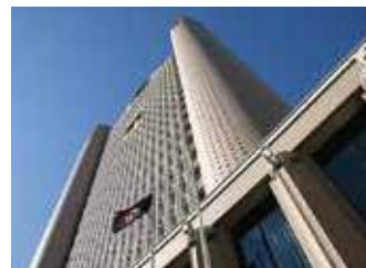
◎各プレゼンテーションのテーマや実施時間についてはP15~をご確認ください。